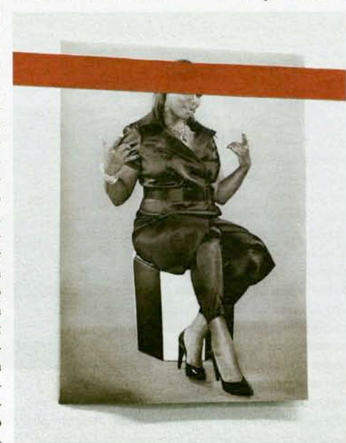
This page – Ian Wallace, Magazine Piece (1970), 2008.

Installation views of A Literature of Images , Witte de With, Rotterdam, 2008.