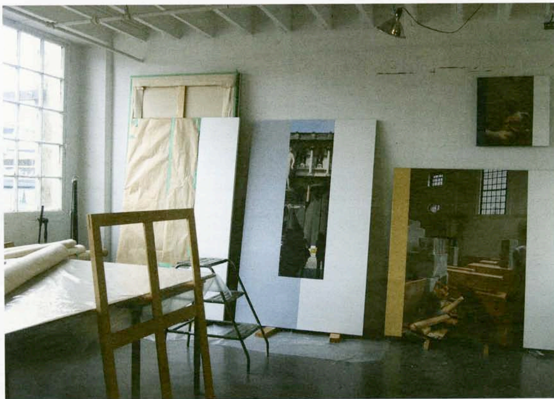
Opposite - Ian Wallace, Abstract Drawing with L'indifferent , 2009.