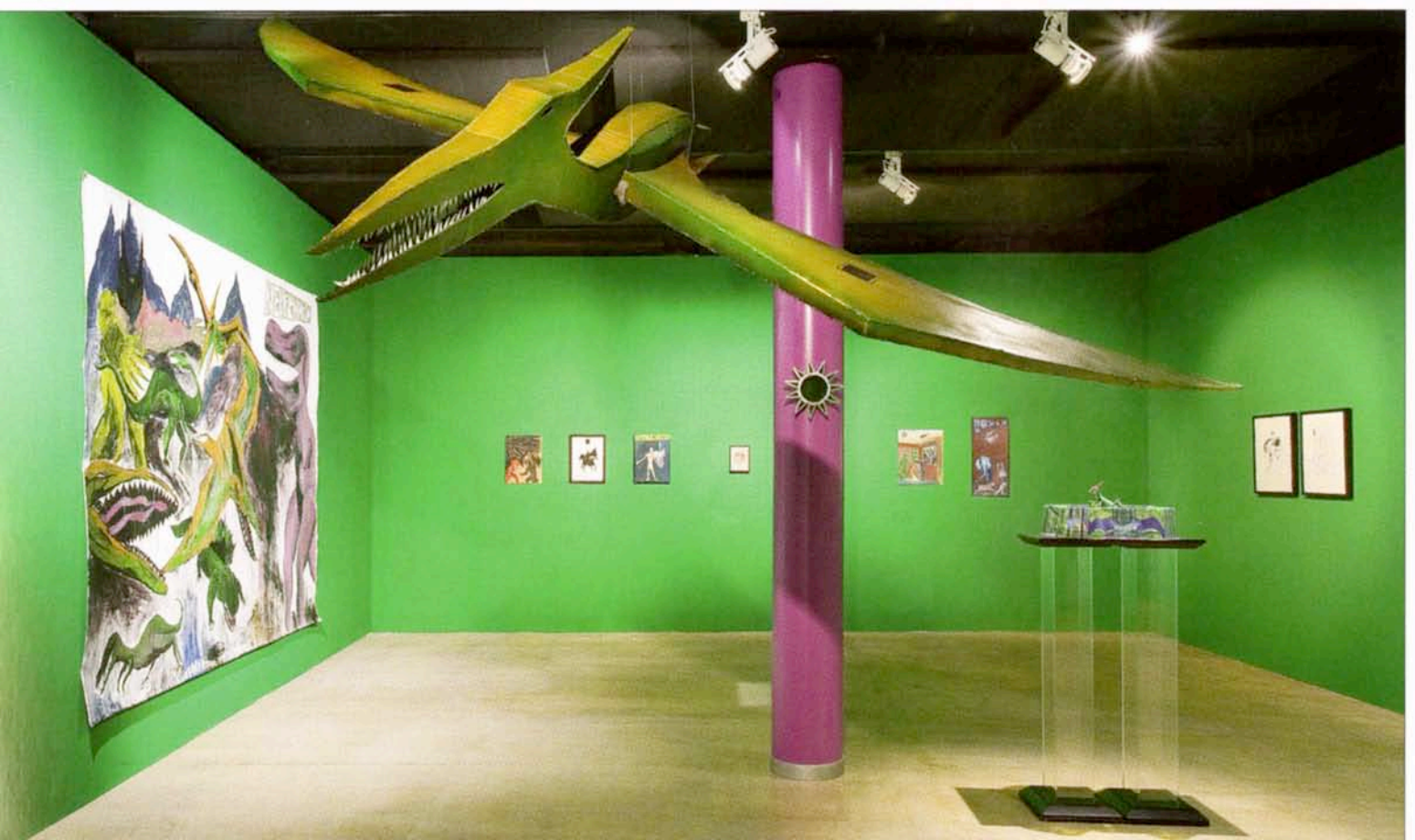
ANDREAS HOFER, Never World, 2005.

Time“ stammt. Von einem dunklen Vorraum aus blickt man gleichsam im 3D-Format in eine futuristisch gefaltete Höhle, die in geheimnisvolles Licht getaucht ist. An den Wänden befinden sich enigmatische Tafelbilder, zwei kleine magisch-kosmische Filme und Uhrzeiger, welche lautes Ticken begleitet. Menschliche Zivilisation wird verkörpert durch die unterlebensgroße Skulptur eines Arbeiters mit gleich zwei grässlich grimassierenden Glatzköpfen – spontan fühlt man sich an Lichtinstallationen von Bruce Nauman erinnert – und durch einen stark stilisierten Baum, der Aufnahmen von Abi Warburgs Schlangenritual evoziert und somit Evoluti-