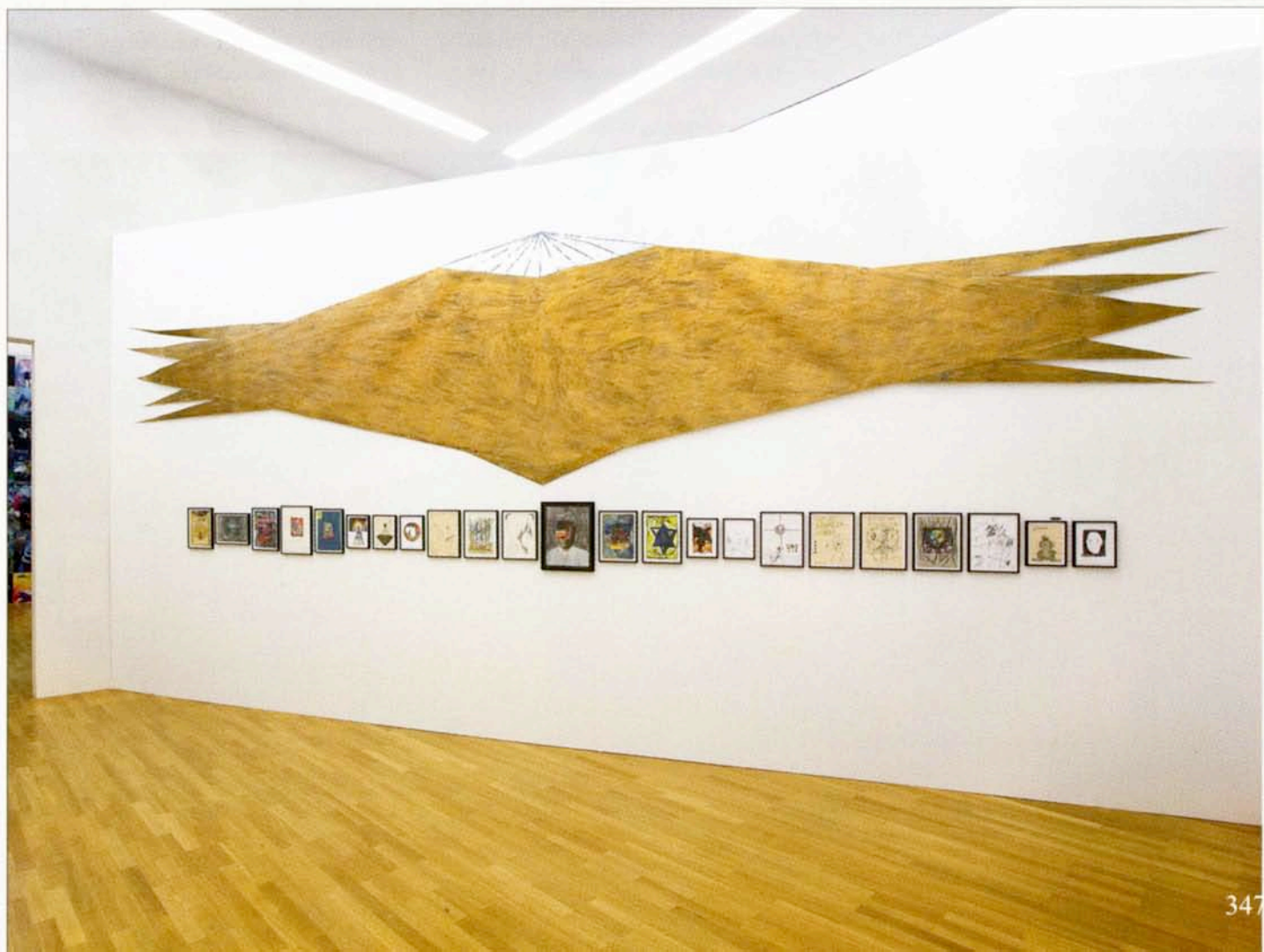
ANDREAS HOFER, Your Day, 2005. Courtesy Sammlung Goetz. Foto: Roman März, Berlin

me und Totenköpfen. Für die zweite Installation „Your Day“ (2005) wurde der Raum mit einer schräg eingezogenen Wand deutlich gekappt. Auf dieser breitet sich ein riesiges goldenes Ufo über eine 23-teilige Reihe von Papierarbeiten aus. Hier lässt sich Hofers ausgefeilte Bildregie bestens veranschaulichen: Nahezu jedes einzelne der schlicht schwarz gerahmten, eindrucksvollen Bilder