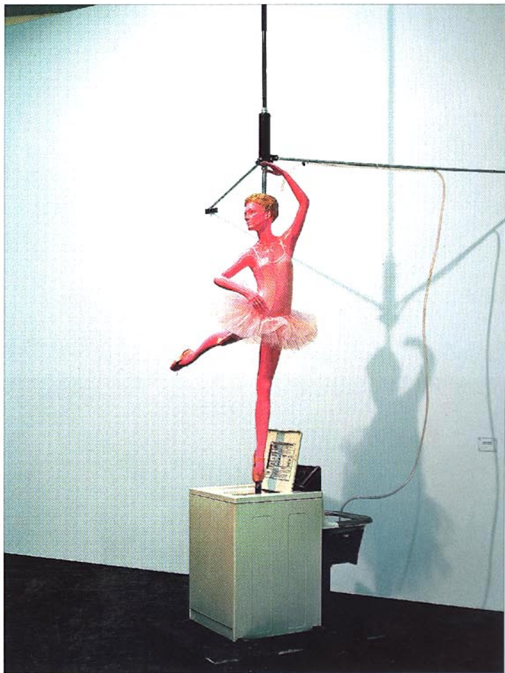
RICHARD JACKSON, Ballerina in a Whirlpool (1997), Polyesterharz, Fiberglas, Waschma- schine, Waschbecken, Stahl, Pumpe, Kunststoffschlauch, Textilien, 304,8 x 68,6 x 139,7 cm; © Hauser & Wirth Collection

mit der der Druckroboter seine im- mergleichen Kreise aufs Papier stanz, die Uhrzeiger zu jeder vollen Minute synchron mit einem tausendfachen Klack weiterspringen, spielt im Bild des kreisrunden Zifferblatts der li- neare Fortgang der Zeit in einen aus- weglosen Kreisgang hinüber. Als Me- tapher mythischer Geschlossenheit